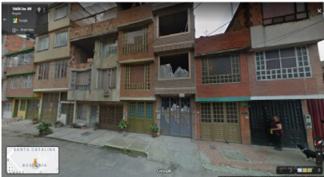
Fotografía N°3. abril 2019, estado inicial del predio con CHIP catastral AAA0148KNSK.

De acuerdo con la temporalidad del predio con chip catastral AAA0148KNSK, se logra identificar que en el mes de abril del año 2019 existía un edificio de 4 pisos, (fotografía N°3); cabe resaltar que en visitas realizadas en lo corrido del año 2019 al PEDH de techo no se observó inicio de actividades constructivas, presentando así, las mismas características en los años 2019 y 2020.