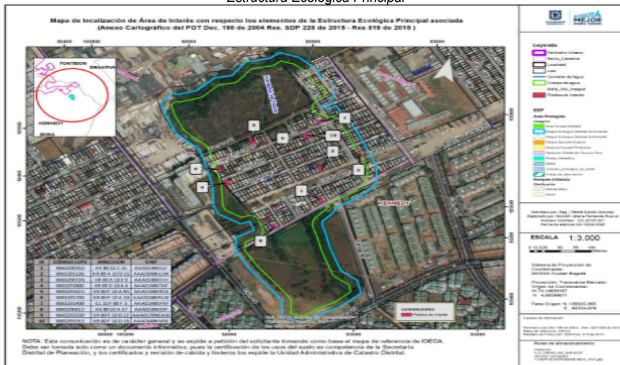
Plano No 1. Mapa de localización de predios y puntos de interés con respecto a los Elementos de la Estructura Ecológica Principal

NOTA: Esta comunicación es de carácter general y se expide a petición del solicitante tomando como base el mapa de referencia de IDECA. Debe ser tomada solo como un documento informativo, pues la certificación de los usos del suelo es competencia de la Secretaría Distrital de Planeación, y los certificados y revisión de cabecera y linderos los expide la Unidad Administrativa de Catastro Distrital.